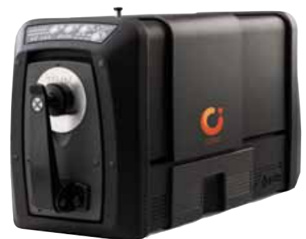
Gli spettrofotometri a sfera Ci7800 e Ci7600 di ultima generazione offrono più valore a tutte le supply chain del colore

I nuovi spettrofotometri di X-Rite, ovverosia il modello di alta gamma Ci7800 e la versione più economica Ci7600, rappresentano un eccezionale balzo in avanti nella produzione e gestione dei preziosi dati provenienti dalle misurazioni cromatiche eseguite lungo l'intera supply chain del colore. A differenza di tutti gli spettrofotometri industriali che li hanno preceduti, gli spettrofotometri a sfera Ci7800 e Ci7600, uniti al software Color iControl di X-Rite, possono integrarsi in qualsiasi supply chain del colore (comprese quelle che impiegano strumenti di altri produttori). Inoltre, se abbinati a Color iQC o Color iMatch, gli spettrofotometri serie Ci7800 e Ci7600 garantiscono automaticamente una corretta impostazione degli strumenti, tengono traccia delle conformità ai requisiti di misurazione e registrano le immagini relative a ogni campione misurato. Il risultato è un processo di misurazione e gestione